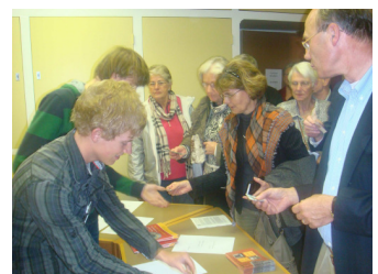
Erasmusnacht 2010: Stagiaires helpen bij EGG- activiteiten.