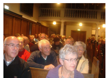
Erasmusnacht 2010: Sint-Joostkapel Gouda