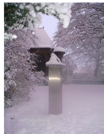
Erasmusbuste - Vroesentuin Gouda